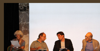
Journée associative du 26 juin 2015

2 assemblées générales 3 conseils d'administration 5 bureaux 7 comités techniques