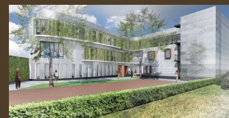
Le projet Broussais